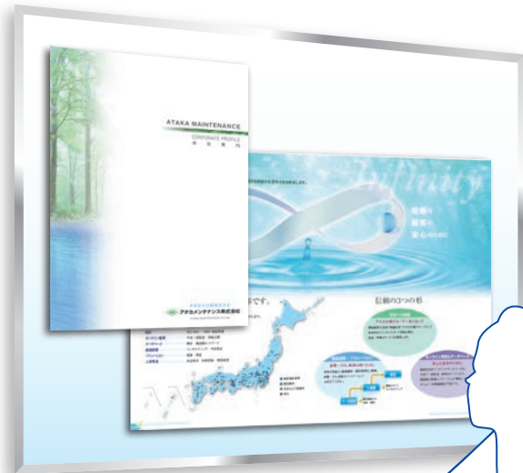
メンテナンス業務関連会社 会社案内