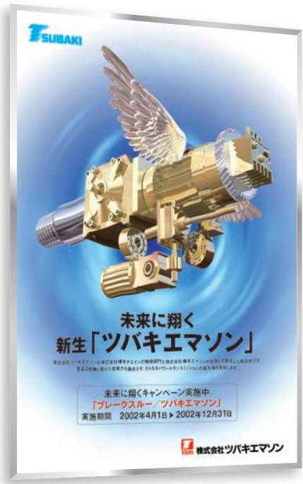
機械メーカー キャンペーンポスター