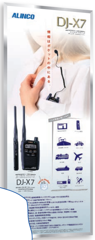
電子機器メーカー 製品ポスター