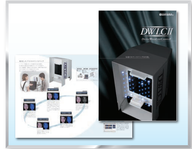
理美容機器メーカー 製品カタログ