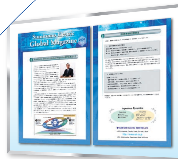
非鉄金属メーカー 海外向け社内報