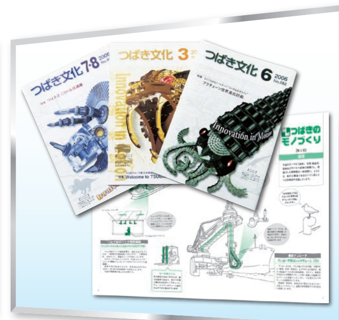
機械メーカー 社内報