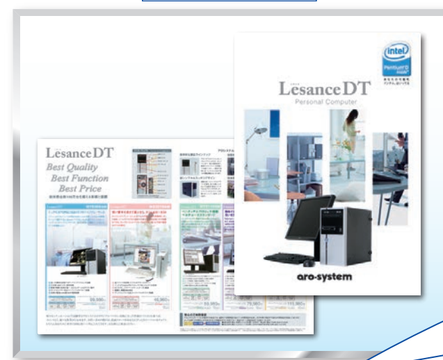
PC メーカー 製品カタログ