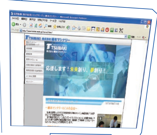
機械メーカー Webサイト トップページ Flash