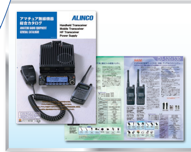
電子機器メーカー 総合カタログ