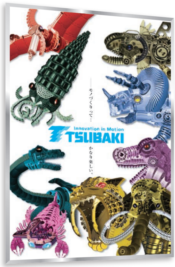
機械メーカー 広報ポスター