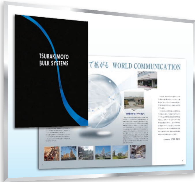
機械メーカー 会社案内