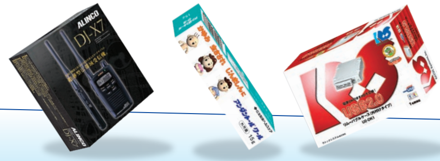
電子機器メーカー 製品パッケージ